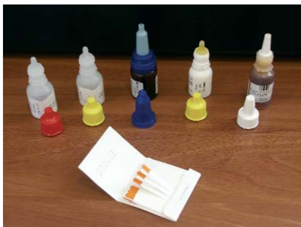
Fármacos objeto del estudio en sus formatos habituales

El empleo de estos fármacos redunda en una mayor facilidad para el trabajo diario y en algunos casos fiabilidad a la hora de realizar determinadas pruebas diagnósticas, que en la actualidad o no se hacen, o se efectúan a base de ingenio y mucho más trabajo.