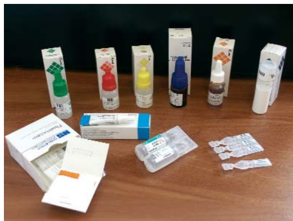
Fármacos usuales en consulta en sus formatos más habituales

Los efectos secundarios sistémicos que se relatan en las tablas, son de muy remota aparición, normalmente asociados a la instilación periódica o indiscriminada, aunque en otros casos son consecuencia de pocas gotas. Es conveniente que el paciente conozca las sensaciones que va a padecer y lo normal sería relatar los posibles efectos en un consentimiento informado conciso pero legal.