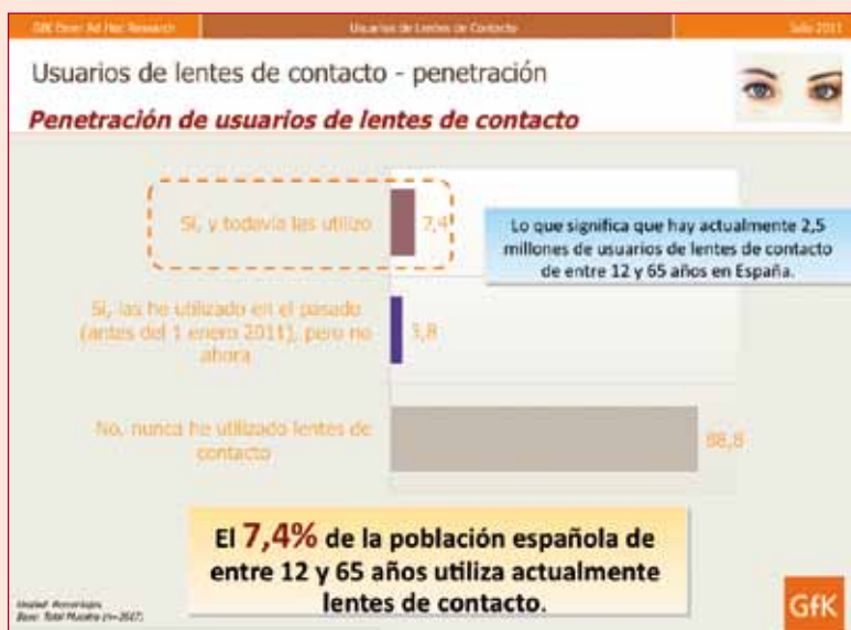
Figura 1. ¿Ha utilizado usted alguna vez lentes de contacto?