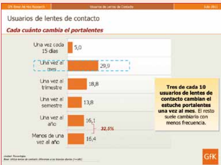
Figura 7. ¿Cada cuánto tiempo cambia usted el portales o estuche para guardar las lentes de contacto?

Cuatro de cada diez usuarios de lentes de contacto acuden a un profesional para revisar sus lentes de contacto una vez al año.