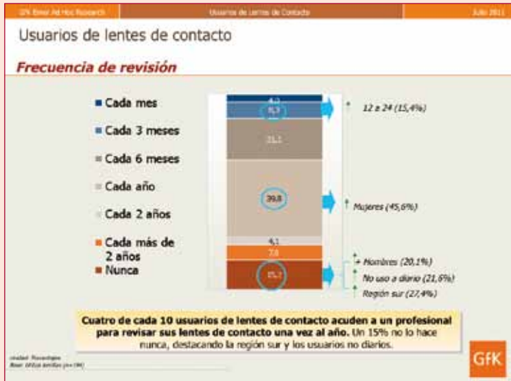
Figura 8. ¿Con qué frecuencia visita usted a su profesional para revisar sus lentes de contacto?