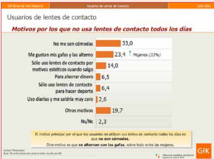
Figura 6. ¿Cuáles son los motivos por los que usted no usa las lentes todos los días?