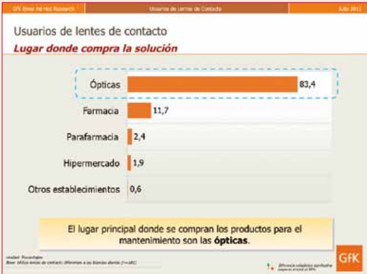
Figura 5. ¿Dónde compra principalmente esta/s solución/es que usted utiliza?